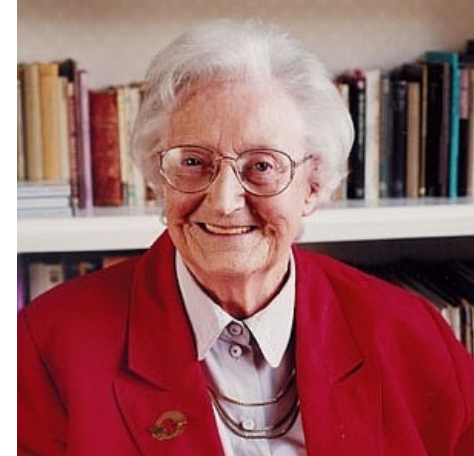
Cicely Saunders (“Velad conmigo”)

“Hasta donde sabemos, la mente y el cuerpo son inseparables, pero la experiencia nos sugiere que no son más que herramientas, y de mucho menos valor que el espíritu, a cuyos propósitos sirven.”